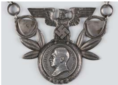
Anhänger der Kette des Frankfurter Oberbürgermeisters Friedrich Krebs von 1933